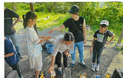
いきいきあまっ子リーダースクール 夏キャンプの様子

子ども会の社会人リーダーとして、子どもの活動に寄り添うと共に、後進のリーダー育成にあたっている。