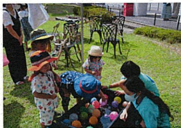
2021年開催の「あわフェス」の様子

あわフェスは「豊岡の良さを再発見」をコンセプトとして、地産品、伝統工芸品、特産品などを身近に感じて貰えるよう工夫している。