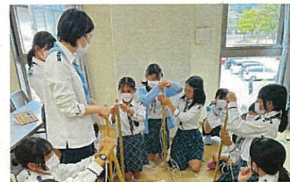
集会でスカウトたちとロープワークをしている様子