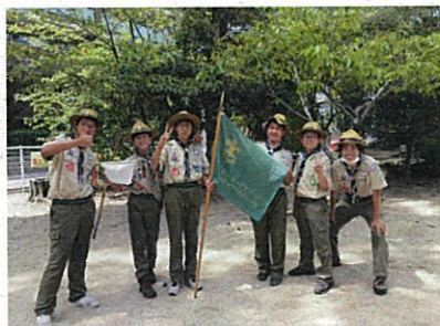
ボーイスカウト隊での夏季キャンプの様子

地域活性化活動団体Q'sの代表としてコロナ禍で地域行事の中止が相次ぐなか手作りの夏祭り「あわフェス」を企画運営し地域の活性化に取り組むなど青少年活動の振興に尽くされました